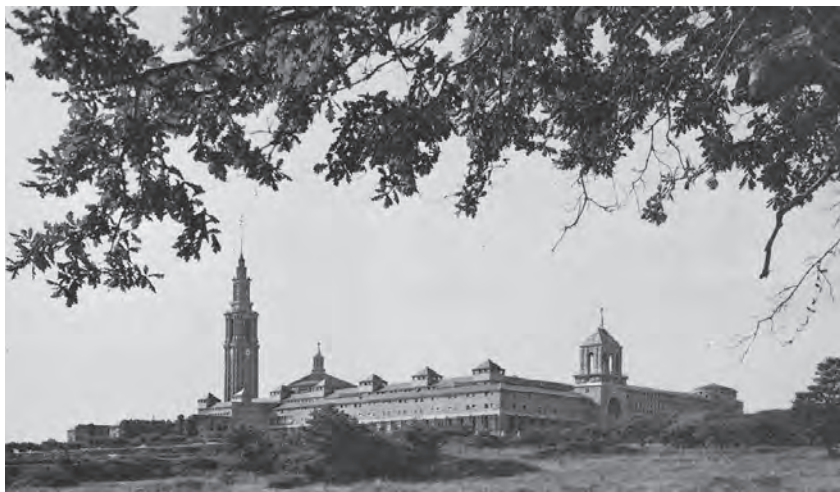
Universidad Laboral de Gijón

Ya en Gijón nos trasladaron hasta la Universidad, emplazada en un lugar alto y sin edificaciones próximas, por lo que se podía divisar desde lejos, en particular la alta torre-campanario (90 m.), donde también se ubicaba un práctico reloj, con esferas visibles en varias fachadas. El recinto, edificios y talleres, eran de una gran magnitud. Según decían, los talleres medían unos tres Km. en su conjunto. También disponía de una granja para autoabastecerse. Y en lo deportivo había campos y pistas de diversas disciplinas deportivas. Todo era tan grande, que su teatro disponía de unas mil butacas, aparte de otros cuatrocientos asientos en el anfiteatro. La dirección y parte