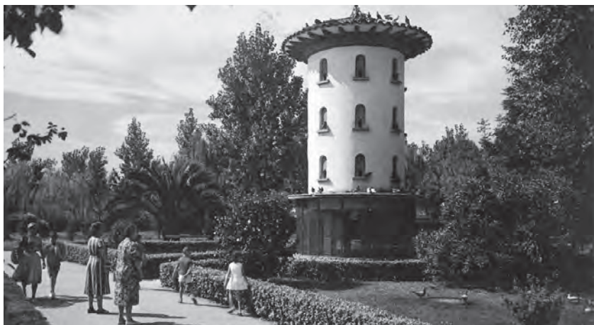
Parque de Isabel la Católica (Gijón)

También era una delicia recorrer el Parque de Isabel la Católica, provisto de unos decorativos y grandes palomares de tres plantas con numerosas ventanas o puertecitas, y el tejado rematado por una veleta; las calles del barrio de