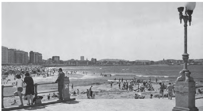
Playa de San Lorenzo (Gijón)

Asimismo participamos, el 21 de agosto, en los actos organizados con motivo del XXVIII aniversario de la gloriosa gesta de la defensa del Simancas, celebrados a las doce de la mañana, en la Capilla de los Padres Jesuitas del Colegio de la Inmaculada, antiguo cuartel del Simancas, donde se ofició una misa rezada a cargo del jesuita P. Constantino Fernández, seguida de una ofrenda de coronas en la explanada ante el monumento, donde formaron una